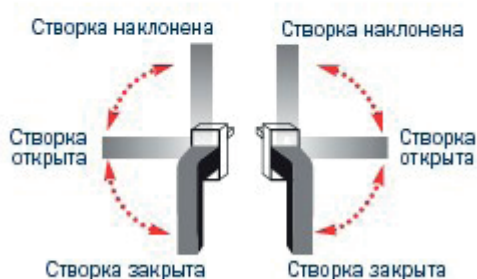
Рис. 2 Схема поворота ручки для открывания поворотно-откидной створки