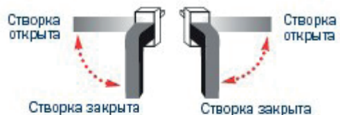
Рис. 1 Схема поворота ручки для открывания поворотной створки

Внимание! Не пытайтесь отворить окно, находящееся в откидном положении (или наоборот). Сначала закройте створку, прижав ее к раме по всей плоскости, а уже затем переведите ручку в нужное положение для обычного открывания.